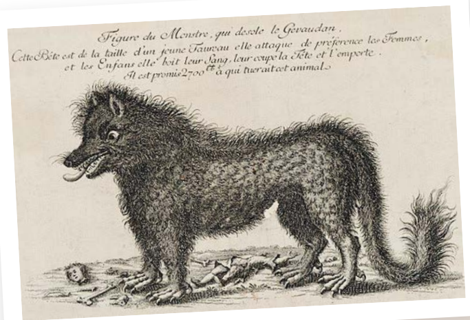
« LE MONSTRE QUI DÉSOLE LE GÉVAUDAN ». GRAVURE SUR CUIVRE 1765.