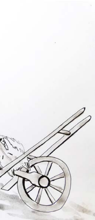
« LE PETIT CHAPERON ROUGE », ILLUSTRATION DE JESSIE WILLCOX SMITH, 1911.