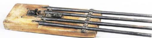
FUSIL À DÉCLENCHEMENT AUTOMATIQUE DESTINÉ À LA CHASSE AU LOUP, 19 e SIÈCLE. (MUSÉE DE LA HAUTE-SAÛNE).